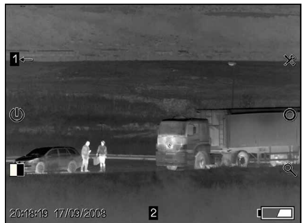
Überwachung und Aufklärung